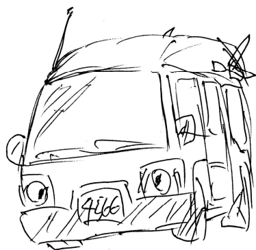
△ コロダマイカー スバルT-111-660

【編集注：現在お持ち帰りバージョンの無料配布は終了しています。よって私の住所も未掲載です。】